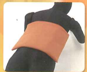
スタンダードタイプ